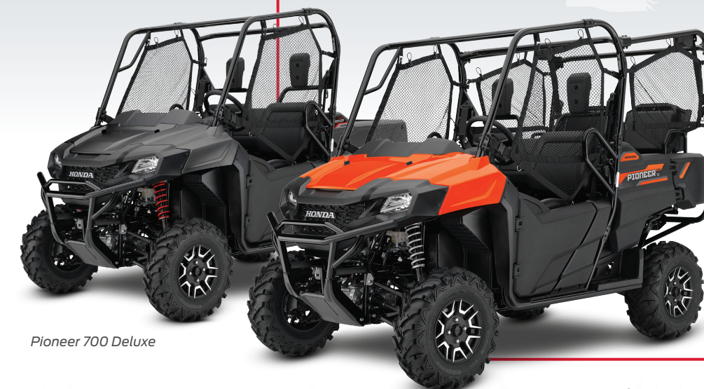
Pioneer 700 Deluxe

Les modèles Deluxe sont équipés de roues en aluminium. En plus d'être élégantes, elles aident à réduire le poids non suspendu pour améliorer la maniabilité et le confort de roulement. La carrosserie peinte, les ressorts de suspension sport et le pare-chocs avant mettent en valeur la conception tout-terrain robuste et unique de ces modèles.