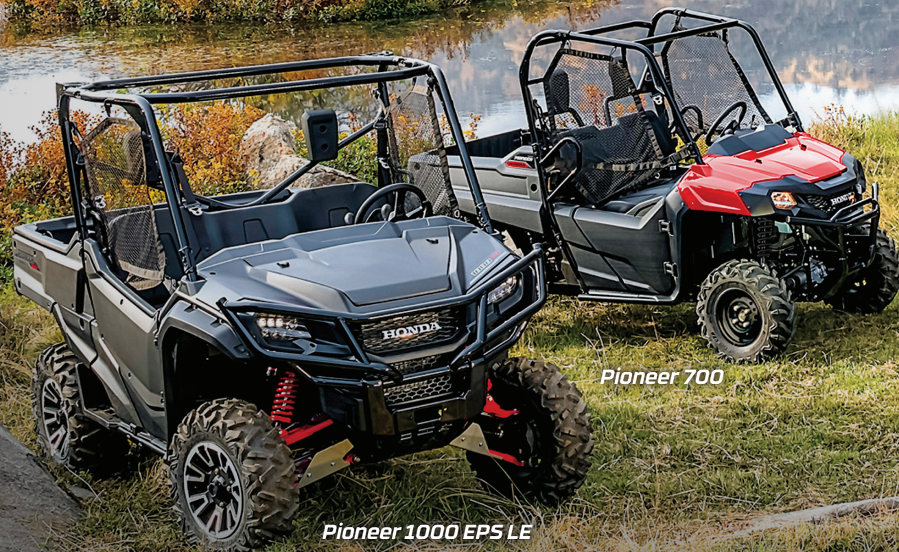
Pioneer 1000 EPS LE

Tous les véhicules côte à côte Pioneer de Honda sont prêts pour l'aventure et vous mèneront pratiquement partout où vous le désirez grâce à leurs capacités hors route légendaires et aux meilleures innovations de l'industrie. Le choix est vôtre, alors ne vous privez pas du plaisir de conduire un véhicule côte à côte de Honda!