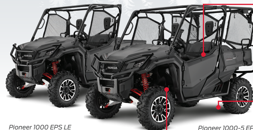
Pioneer 1000 EPS LE

Intégrant la technologie automobile de pointe de Honda, la transmission à 4RM intelligente (I-4WD) comprend le système antipatinage au freinage (BTCS), l'assistance au départ en pente (HSA) et la répartition électronique de la puissance de freinage (EBD). Lorsque cette transmission est engagée, le système antipatinage au freinage transmet une force d'entraînement supplémentaire au pneu ayant le plus d'adhérence pour procurer une meilleure traction rapidement sans la sensation de lourdeur d'un blocage du différentiel.