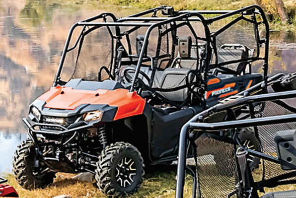
Pioneer 700-4 DELUXE

L'aventure n'est jamais bien loin avec le Pioneer 700 intermédiaire, un véhicule conçu pour offrir du plaisir à chaque virage et explorer les grands espaces. Alimenté par un moteur Honda de 675 cm 3 refroidi par liquide, le Pioneer 700 peut accueillir deux occupants, s'il est équipé d'une caisse basculante pratique, ou jusqu'à quatre occupants, s'il est équipé des sièges de caisse rabattables QuickFlip MC .