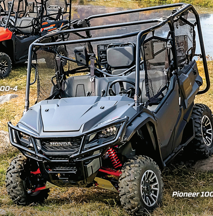
Pioneer 1000-5 EPS LE