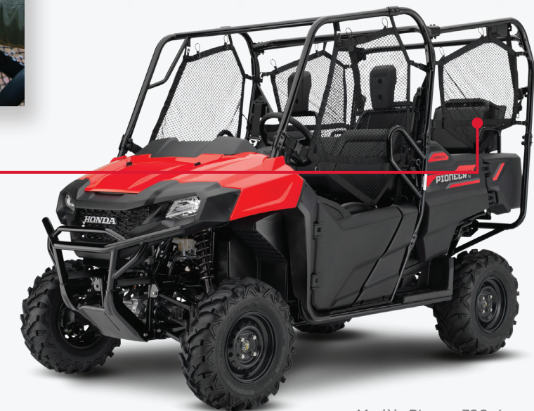
Modèle Pioneer 700-4 montré

La robuste structure de protection des occupants, les portes à double loquet de style automobile, les filets latéraux enroulables et les ceintures de sécurité à triple point d'ancrage contribuent ensemble à vous garder en toute sécurité, vous et vos passagers.