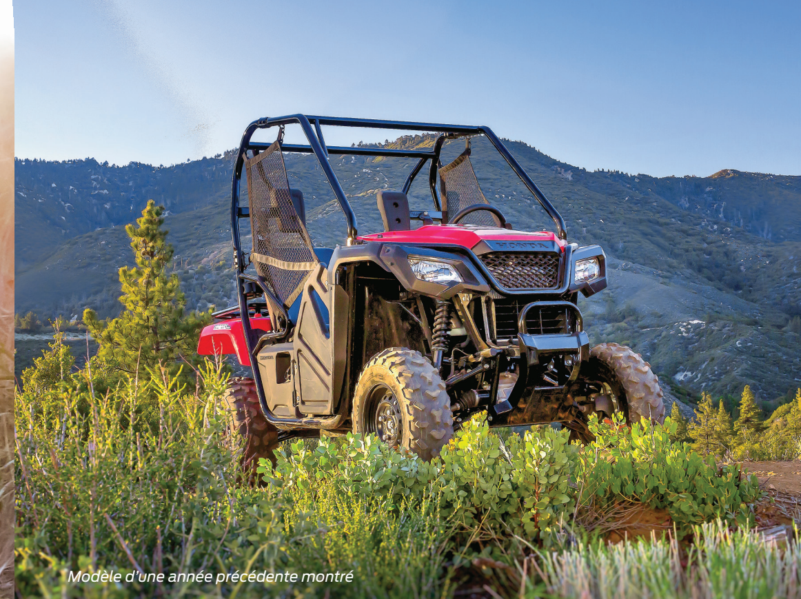
Modèle d'une année précédente montré