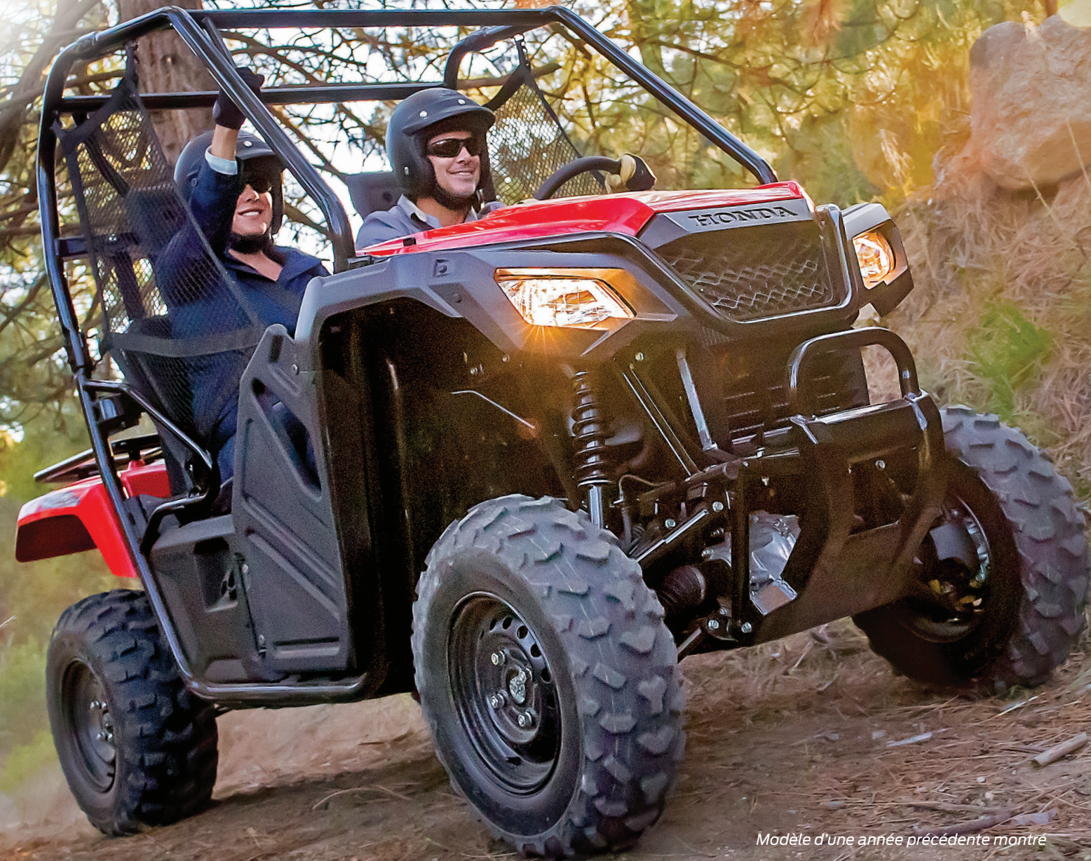
Modèle d'une année précédente montré